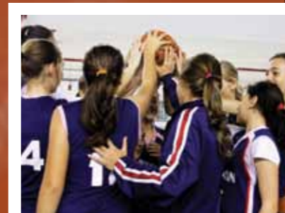
18h - “Hoje tem que enterrar, hein!”

19h20 “E aí, ganharam?”, pergunta Tio Marcos. “Ouro para as meninas e prata para os meninos.” Segue-se para o Sabin, onde muitos ainda verão o jogo de Basquete do infantil no Festival Sabin+Esportes&Cultura. Agora é aproveitar o final de semana. A segunda-feira os espera com avaliações e mais treinos. Eles sabem que, com dedicação e esforço, estarão prontos não apenas para as próximas competições nas quadras, mas também para os desafios que a vida lhes reserva.