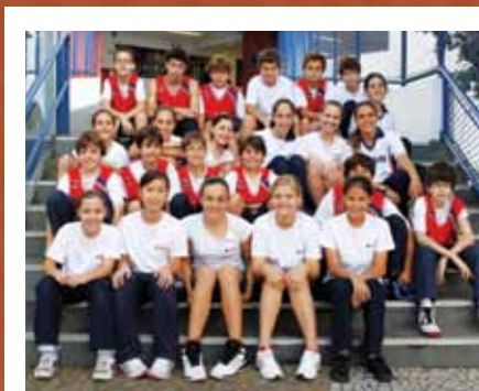
16h22 - Concentrações antes da partida

O MAIS acompanha atletas do basquete em um dia de competição fora do Sabin.