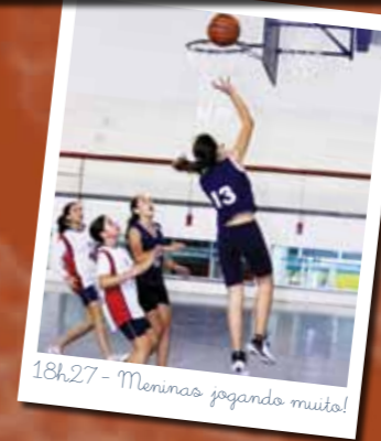
18h27 - Meninas jogando muito!