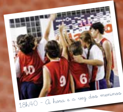
18h40 - A hora e a vez dos meninos