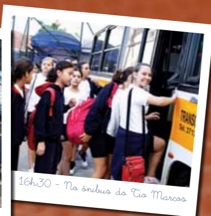
16h30 - No ônibus do Tio Marcos