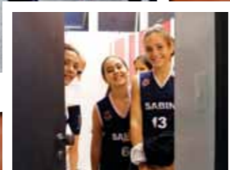
17h40 - No vestiário do Magno

Sexta-feira, 25 de maio. Para a maioria dos alunos, um dia normal de aula. Para os membros das equipes masculina e feminina de Basquete pré-mirim (6º e 7º anos), um dia decisivo. Eles estão prestes a disputar a final da Olimagno, a Olimpíada do Colégio Magno. O MAIS acompanhou o dia desses alunos para descobrir como eles se preparam física e psicologicamente para tais momentos de desafio. E como conseguem conciliar o calendário esportivo com as responsabilidades acadêmicas, de forma a continuar marcando pontos, nas quadras e na sala de aula.