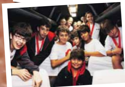
19h20 - Medalhas no peito